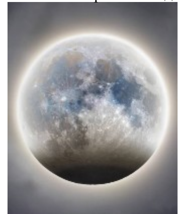
Рисунок 1. Снимок частного лунного затмения 28 октября 2023 года

В описании лунного затмения, произошедшего 28 октября 2023 года, на одном из интернет-сайтов было сказано: «...28 октября произойдет частное лунное затмение. Наблюдать его можно будет примерно в 22 часа, в Северном полушарии оно будет достаточно хорошо видно. Его длительность практически полтора часа. Луна в это время приобретет красноватый оттенок, так как ее частично закроет земная полутень».