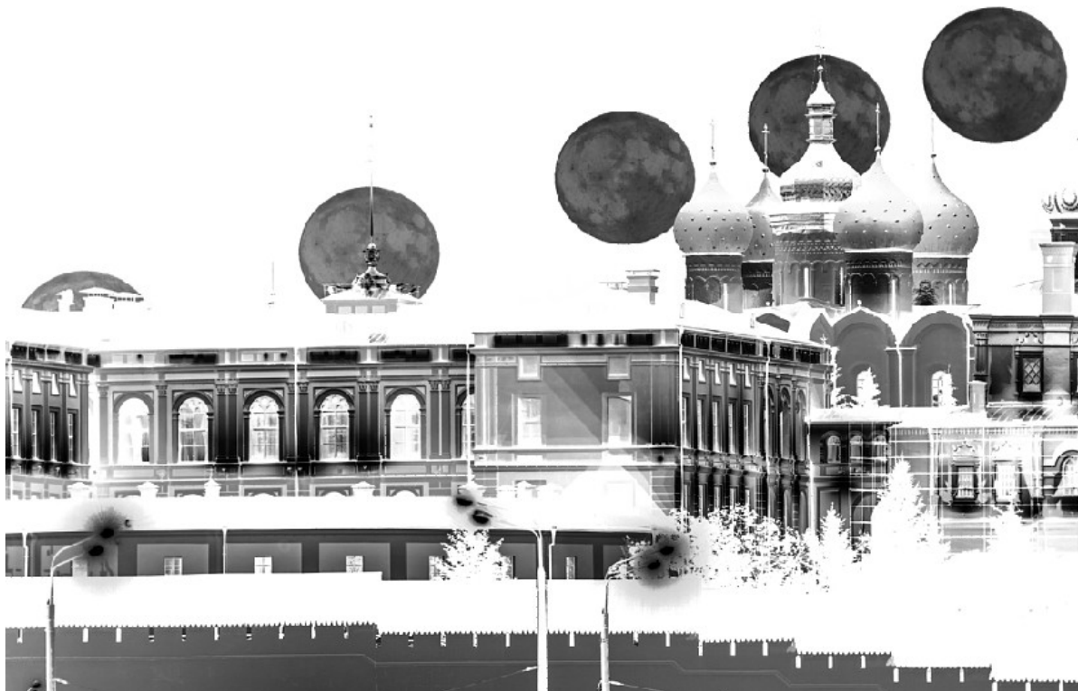
Рисунок 2. Луна над Казанским Кремлём.

Восход или заход Луны над Казанским Кремлём изображён на фото (рис 2), полученном в режиме мультиэкспозиции (когда на один кадр делается несколько снимков)?